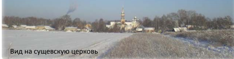
Вид на сущевскую церковь

«Если Христос не воскрес, то и проповедь наша тщетна, тщетна и вера ваша» (1Кор 15, 14)