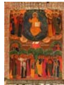
Зузинская икона «Собор всех святых»