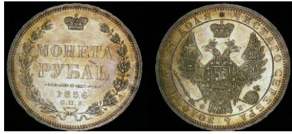
Серебряный рубль 1856 года